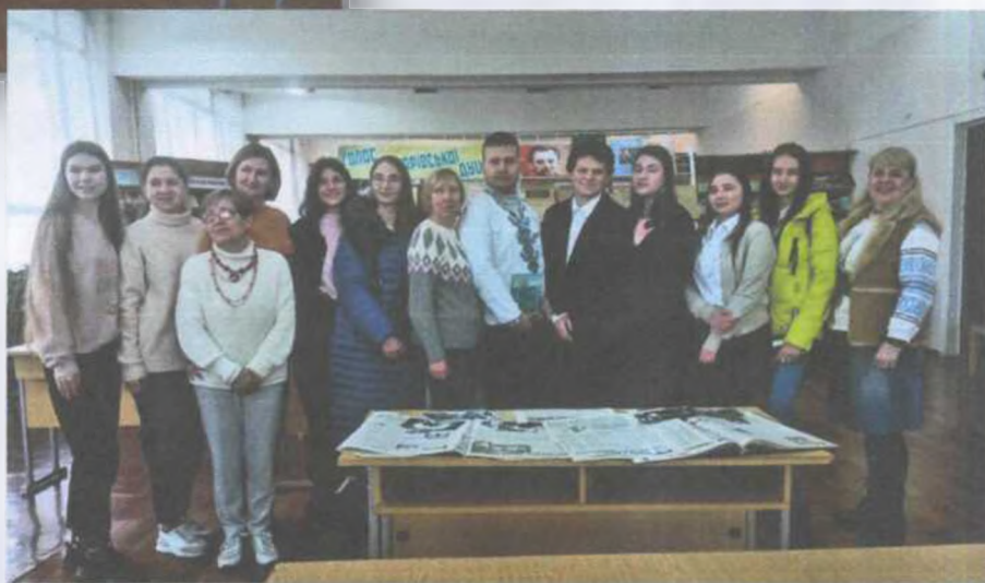
Перше знайомство з бібліотекою у День захисту дітей